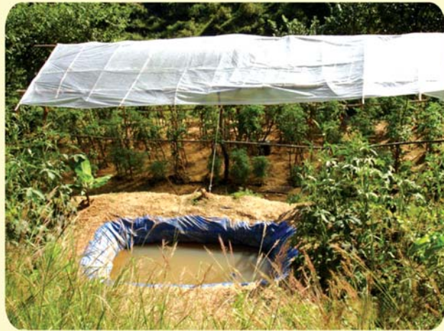
प्लाष्टिक घर भित्र वेमिसमी गोलमेडा खेती