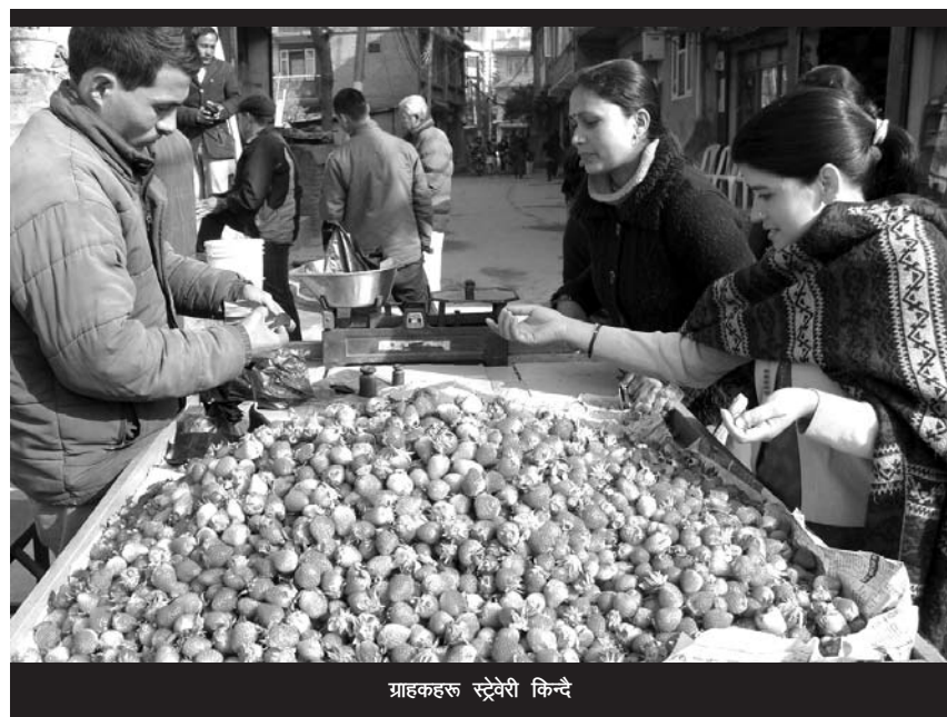
ग्राहकहरू स्ट्रेवेरी किन्दै