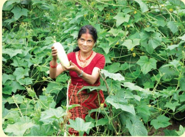
वेमिसमी काँक्रो खती